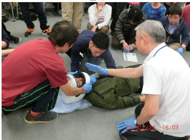
ヘルメットを脱がせる